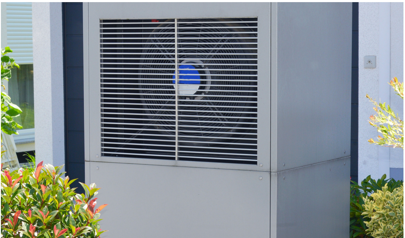
Die geräuschlosen Ventilatoren werden in Wärmepumpen integriert.

Welche Basis bietet dazu der nächste, der 6. Bionik-Kongress Baden-Württemberg am 06. Mai 2025 im John Deere Forum Mannheim?