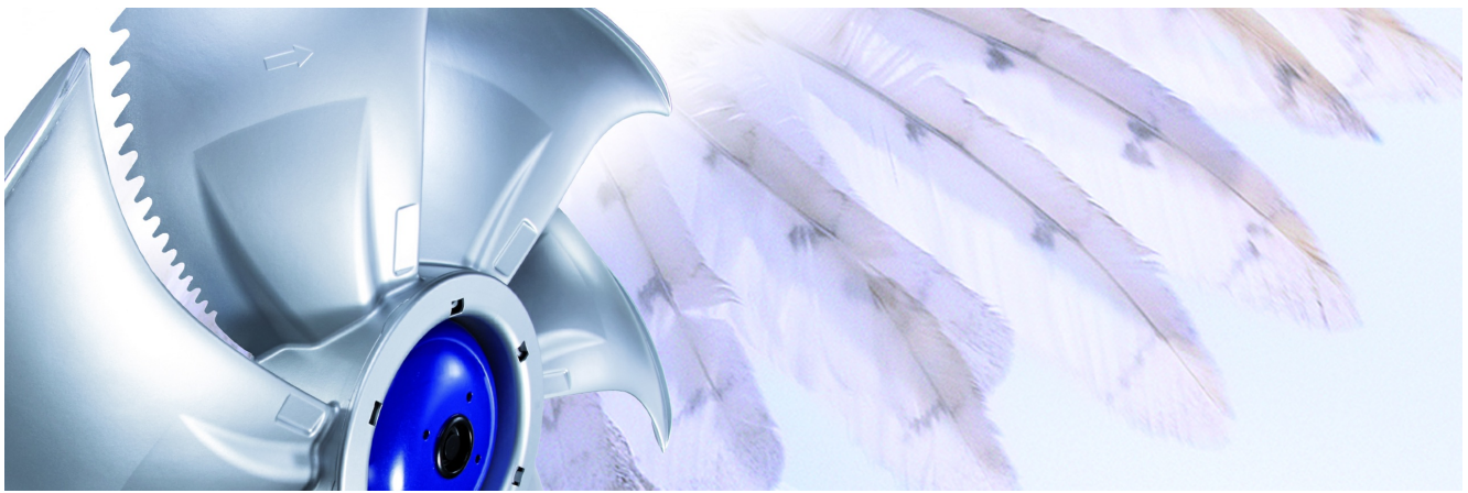
Bei dem Axialventilator FE2owlet wurde der Eulenflügel als Vorbild genommen und dessen Kontur und Struktur auf den Ventilatorflügel übertragen.

Salpetersäure hat und in der Natur einen Stoff mit dem gleichen Oxidationspotenzial gesucht. Bei der Suche sind wir schnell auf Neurotransmitter wie Dopamin und Serotonin gestoßen. Im Labor konnten wir zeigen, dass man bei Umgebungstemperatur Metalloberflächen gefahrlos für die Mitarbeitenden mit Dopamin brüunieren kann. In der Praxis der Oberflächentechnik wollte (bisher) keiner den erheblichen Preisunterschied bezahlen. Ich will mit diesem Beispiel zeigen: auch in solchen extremen Praxisfällen hat die Natur Lösungen für die technische Anwendung parat.