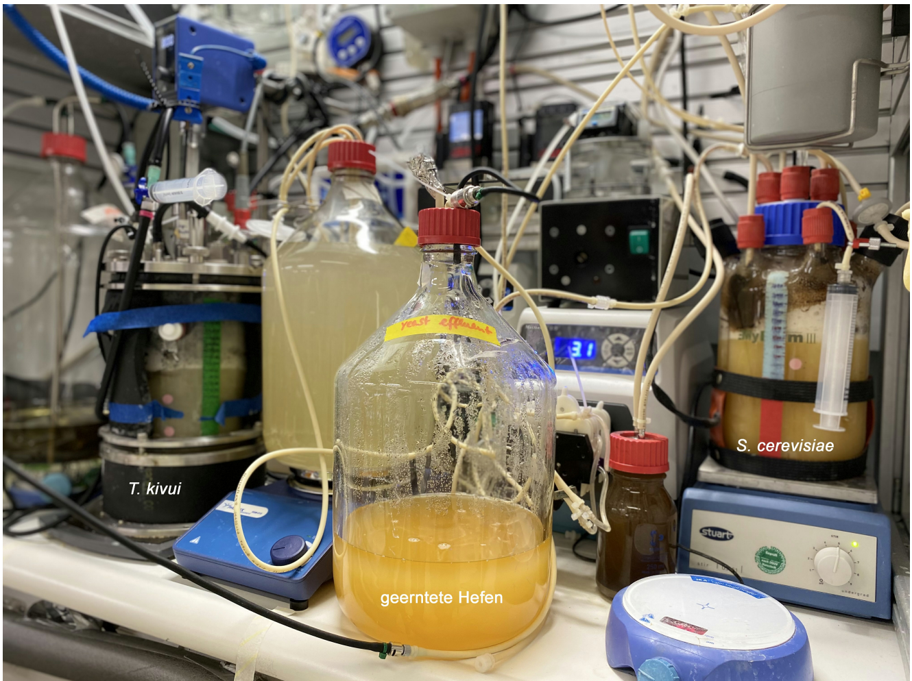
Zweistufiges Bioreaktor-System im Labormaßstab. Im linken Bioreaktor wird das Bakterium T. kivui kultiviert, im rechten die Hefe S. cerevisiae . In der vorderen Flasche befinden sich geerntete Hefen.

In einem zweiten Reaktor ziehen die Forschenden Zellen der in der Lebensmittelindustrie gebräuchlichen Bäckerhefe Saccharomyces cerevisiae an, die sie mit dem nachhaltig hergestellten Acetat füttern. Üblicherweise verstoffwechseln diese einzelligen Pilze Kohlenhydrate wie Glucose (C 6 H 12 O 6 ). Sie sind aber durchaus in der Lage, auch andere C-Quellen zu nutzen. Seit einiger Zeit dienen die inaktivierten Organismen in Form von Hefeflocken als wertvolle Nahrungszusätze, da sie viele Proteine und Mikronährstoffe enthalten. „Konventionelle Herstellungsverfahren basieren aber immer auf Ackerbau, denn die zugesetzte Glucose wird aus pflanzlicher Stärke gewonnen“, erklärt Schmitz. Die auf Acetat gewachsenen Pilze besitzen im Vergleich zu verschiedenen Fleischsorten, Thunfisch oder Linsen mit etwa 40 Prozent einen wesentlich höheren Proteinanteil und sind somit gut als alternative Eiweißquelle geeignet. 7)