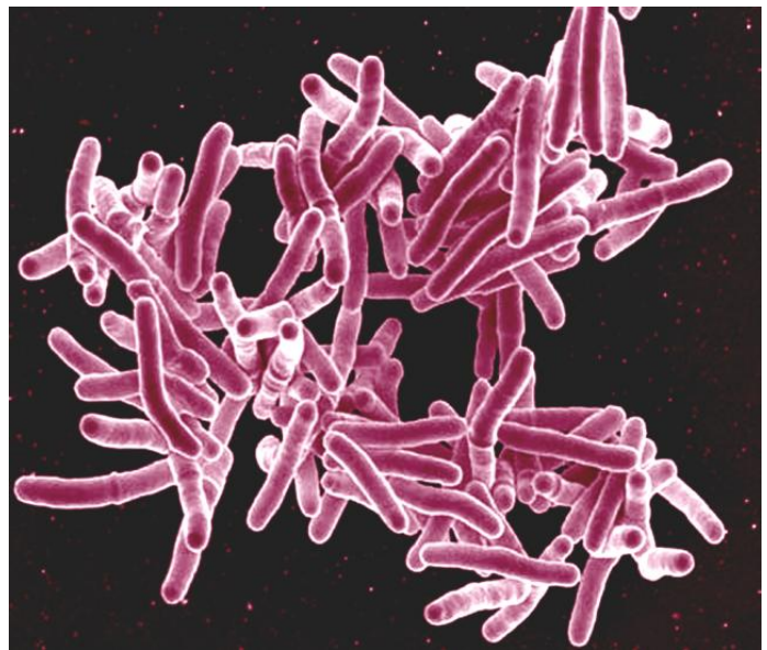
Rasterelektronenmikroskopische Aufnahme der Tuberkulose-Erreger ( Mycobacterium tuberculosis ).

„Bei Tuberkulose ist nicht die Behandlung das Problem, sondern die vorherige Diagnose bzw. das Monitoring des Therapieansprechens“, führt die Medizinerin weiter aus. Aufgrund der unspezifischen Symptomatik ist grundsätzlich der Nachweis des Erregers erforderlich. Aber im Gegensatz zu HIV oder COVID gibt es bisher noch keine einfachen Methoden wie beispielsweise Lateral-Flow-Schnelltests. Und da das Anzüchten einer Laborkultur sehr aufwendig ist und mehrere Wochen dauert, wird das Bakterium auch heute noch meistens wie zu Zeiten Robert Kochs unter dem Mikroskop identifiziert. Hierfür wird Sekret aus den tiefen Atemwegen, sogenanntes Sputum, benötigt. Kinder unter fünf Jahren sind allerdings kaum in der Lage, dieses abzugeben, weshalb ihnen in einer nicht ganz einfachen Prozedur mit Hilfe eines Röhrchens Proben aus der hinteren Nase oder dem Magen entnommen werden müssen. Dieses Verfahren erfordert Zeit und Expertise, die in den betroffenen Regionen nicht vorhanden sind. Ein klarer Hinweis auf eine Infektion durch die App könnte die Aktivitäten kanalisieren und Erkrankten zu einer schnelleren Diagnose verhelfen. Die Behandlung einer aktiven Tuberkulose erfolgt dann über insgesamt sechs Monate mit einer Kombination aus vier verschiedenen Antibiotika.