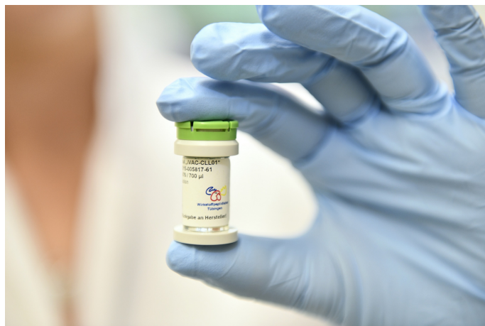
Der fertige Impfcocktail wird in ein Impfstoff-Gefäß abgefüllt.

Interessierte Patienten wenden sich am einfachsten unter der E-Mail: kketi@med.uni-tuebingen.de an das Team.