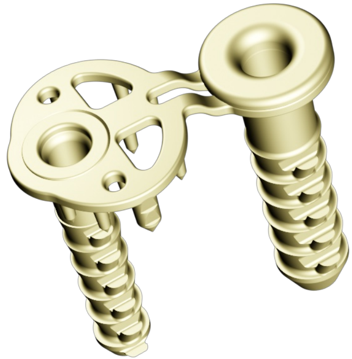
SINEFIX ist ein Implantat für die Schulter und besteht aus zwei Anker und einer Basisplatte mit winzigsten Krallen.

SINEFIX heißt die fingernagelgroße Innovation des Start-ups und ist ein Implantat aus PEEK (Polyetheretherketon), einem biokompatiblen Kunststoff. Es besteht aus drei zusammenhängenden Teilen: zwei Anker, ähnlich den auch bisher verwendeten Fadenankern plus einer Basisplatte mit winzigsten Krallen, die die beiden Anker flächig verbindet. „Dieses Implantat ersetzt Fäden und Knotenkonstruktion, indem die bisherigen Druckpunkte des Fadens und die Kräfte auf einer einzigen Fläche – der Basisplatte - verteilt werden, die maximale Auszugskraft bietet, aber dabei die Sehne nicht quetscht und die Durchblutung ermöglicht“, erklärt der Inovedis-Geschäftsführer. „In Untersuchungen konnten wir zeigen, dass sowohl Zugfestigkeit als auch Spaltbildung wesentlich günstiger sind als mit der herkömmlichen Fadenkonstruktion. So verhaftet die Sehne stabil an ihrem ursprünglichen Ansatz am Knochen, die Einheilungschancen sind optimal und die mechanische Belastbarkeit ist deutlich besser. Das Implantat sorgt zudem auch für einen signifikanten Mehrwert bei der Versorgung von Patientinnen und Patienten mit Rotatorenmanschettenläsion, da teilgerissene Sehnen nunmehr vorab nicht mehr komplett abgelöst werden müssen.“